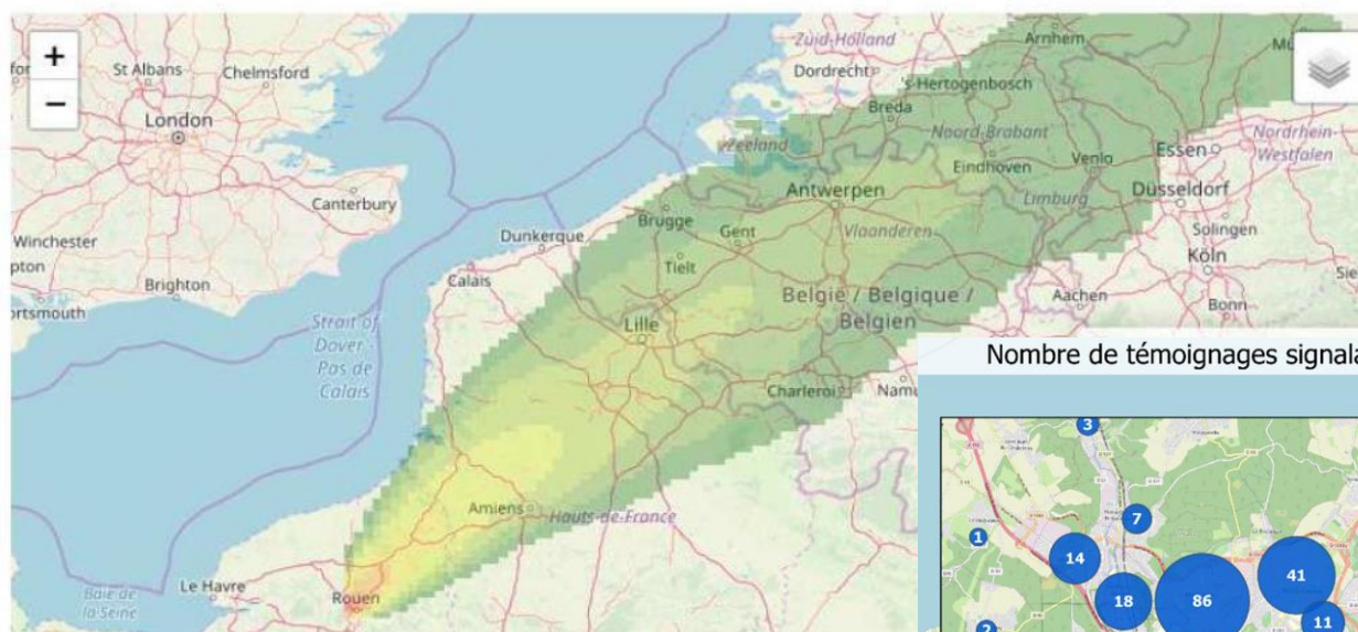
Nombre de témoignages signalant des odeurs du 26/09 au 16/10