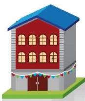
Maison de retraite «Au Bon Repos »

Interne à Jules Ferry, habite par ailleurs à Beauvillage chez ses parents