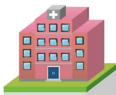
Lycée «Jules Ferry»