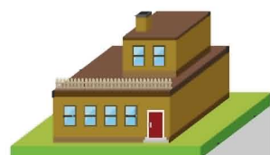
Prison «Les barreaux»

À la maison de retraite « Au Bon Repos », a aussi une maison à Beauvillage